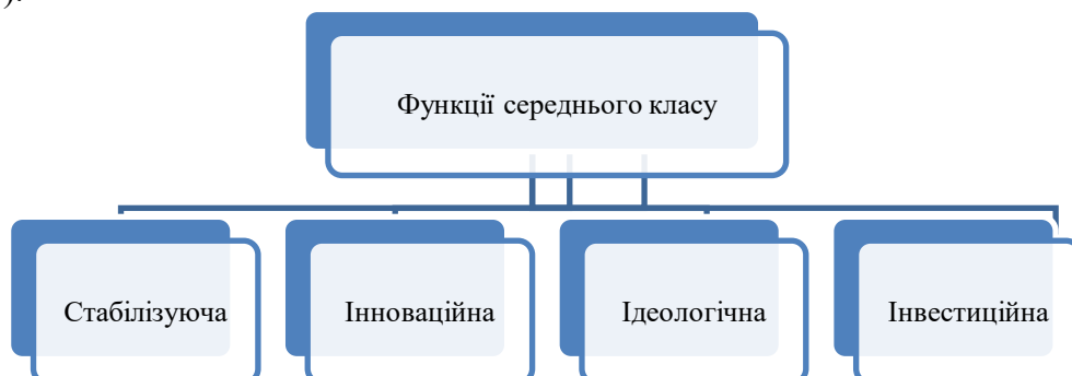
Рис. 1. Функції середнього класу

На даний момент західні джерела схилиються до того, що середній клас зацікавлений не просто в розвитку, а в стабільному розвитку та являє собою основу для формування та підтримки стабільності суспільства. У країнах з розвинутою ринковою економікою, саме середній клас являє собою найчисельнішу соціальну групу, яка виконує низку важливих функцій (мал.1).