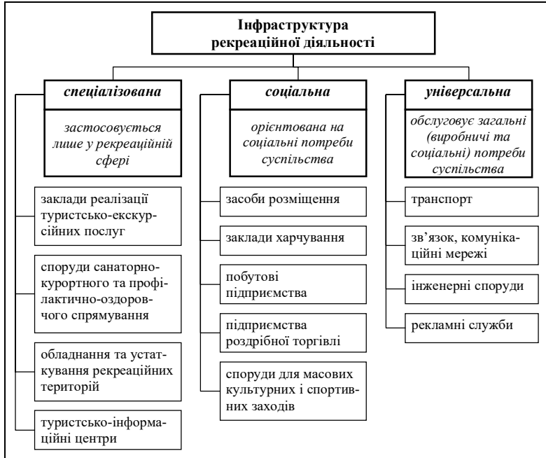
Рис. 1. Види інфраструктури рекреаційної діяльності залежно від задіявання у рекреаційній та інших сферах життєдіяльності людини (В.І. Новикова, 2010) [10]

Серед різних видів активного відпочинку гірськолижне катання найбільше залежить від природних умов. Першорядне значення має наявність протягом чотирьох–п’яти місяців у році щільного снігового покриву. Іншими факторами, що зумовлюють зручності і привабливості гірськолижного відпочинку, є: висота місцевості, особливості рельєфу, погодні умови гірськолижного сезону, характер рослинності, відсутність лавинної і селевої небезпеки і, безумовно, різноманітність і унікальність ландшафтів. Дослідження природно-кліматичних умов у гірськолижних районах показало, що найбільш популярні з них розташовані на висоті 1500–1800 м над рівнем моря, характеризуються помірно низькими температурами (середня температура січня -5^{\circ}\text{C} \dots -6^{\circ}\text{C} ), тривалим сонячним освітленням (1900–2000 год./рік), великою кількістю снігу (в смузі освоєння до 3 м), розміщенням місць активного відпочинку поза лавинонебезпечними зонами [1].