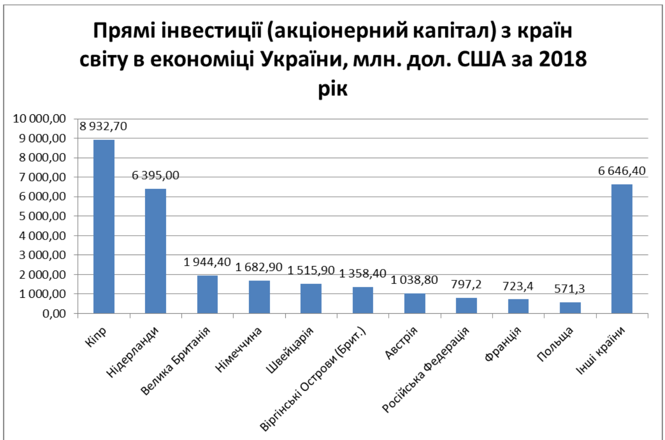
Рис.2.1 Прямі інвестиції (акціонерний капітал) з країн світу в економіці України, млн.дол. США за 2018 рік

Досліджуючи основні країни-інвестори у 2018 році можемо виділити топ-десять країн, на які припадає 79% від загального обсягу надходжень прямих інвестицій (рис. 2.1).