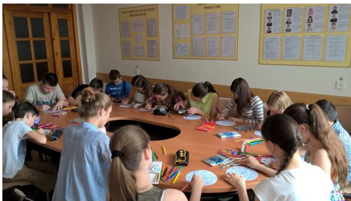
Випробування карт «Інсайт» в літньому таборі «ФОТОН»