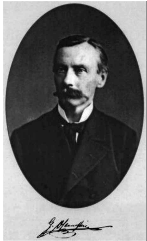
Готфрид Осипович Оссовський (1835—1897)

Протягом 1889—1892 рр. Г. Оссовський проводив розкопки у ряді сіл Борщівського, Гусятинського і Заліщицького повітів Східної Галичини