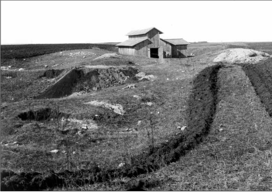
Загальний вигляд на будинок над входом до печери Вертеба. На передньому плані місцевий житель Гнат Перун. Фото 1898 р.