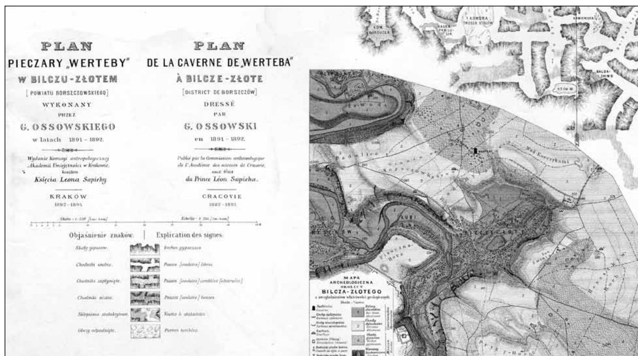
План печери Вертеба та околиць с. Більче-Золоте. Виконаний Г. Оссовським у 1891—1892 рр.(фрагмент)

У листі з Томська до краківської Академії 18 червня 1893 р. він писав про те, що хворів на запалення легенів і тиф, проте незабаром виїжджає на Алтай і хоче знати чи готова вже друга частина літографій по печері з Більча-Золотого.