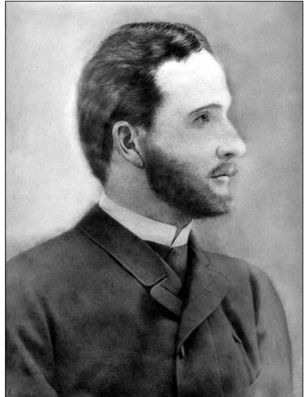
Князь Леон Сап'єга (1856—1895)

Багатство пам'яток старовини в околицях Більча-Золотого надзвичайно вразило, на той час уже досвідченого археолога. Він свідомо оцінював їхнє важливе наукове значення, тому археологічним розкопкам віддавав увесь свій час, часто при цьому забуваючи про обов'язки у краківській Академії. Президент Академії Вміль з Кракова доктор Юзеф Маер у листах до Г. Оссовського, який на той час постійно перебував у Більче-Золотому, часто нагадував йому про вчасне подання до