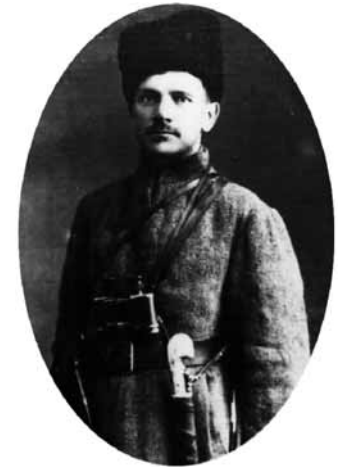
Полковник війська УНР А. М. Вовк