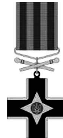
Орден «Залізний Хрест»