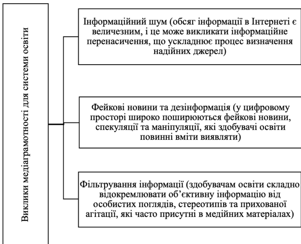
Рис. 3. Виклики медіаграмотності для системи освіти

В цілому, навички критичного мислення та медіаграмотності повинні стати необхідною складовою сучасної освіти, сприяючи формуванню поінформованих, розуміючих та критично мислячих громадян. Для ефективного формування та розвитку медіаграмотності закладам освіти необхідно бути ознайомленими із наявними викликами (рис. 3).