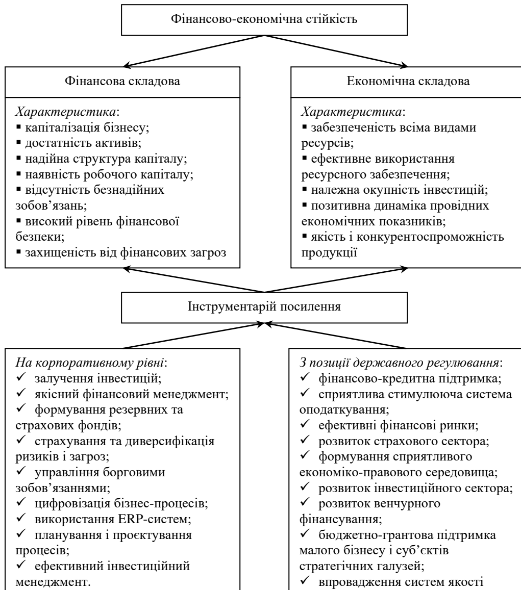
Рис. 1. Змістова характеристика та базисний інструментарій політики забезпечення фінансово-економічної стійкості підприємницького сектора національної економіки

Поєднання заходів, що будуть реалізовані на мікроекономічному рівні з потужною зовнішньою макроекономічною підтримкою дозволить сформувати повноцінну систему забезпечення фінансово-економічної стійкості підприємницького сектора національної економіки України. Разом із тим, фінансово-економічна стійкість це лише передумова активізації інноваційної діяльності і розвитку. Відтак, на наступному етапі держава має реалізувати комплекс заходів, які б мотивували та стимулювали використання нових фінансово-економічних можливостей представників бізнесу в напрямі здійснення (участі в таких проєктах, співпраці з суб'єктами НДДКР, освіти і науки, залучення стартапів, отримання венчурного фінансування, інвестування в інноваційно-технологічні стартапи і т. п.) активної науково-дослідної та дослідно-конструкторської, іншими словами – інноваційно-технологічної діяльності.