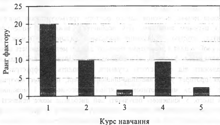
Рис. 3. Розподіл значущості фактору "недостатні умови для розвитку студентів (в інтелектуальній, етичній, естетичній та інших сферах)"

відображенням існуючої суперечності між досить високим рівнем вимогливості студентів до якості навчання, до можливості свого розвитку в стінах університету і тим як у ВНЗ задовольняються потреби розвитку студентів у різних сферах.