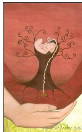
Рис. 18. Моє народження