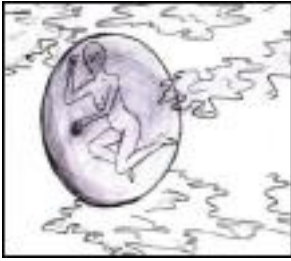
Рис. 5. Самотність