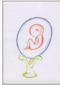
Рис. 6. Мій звичайний емоційний стан