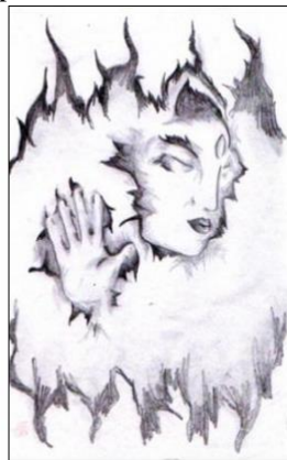
Рис. 20. Мої бажання