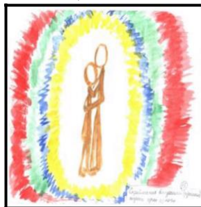
Рис. 10. Сприймання близькими рідними людьми один одного