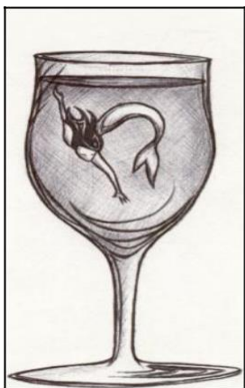
Рис. 16. Я в сім'ї батьків

процесі аналізу перинатальної символіки встановлено, що пологи на символічному рівні зображаються як – зламані двері, сходинок, розбите яйце, розв'язування вузлів, розстібання гудзиків, мотиви космічної поглиненості. Символ сходинок має такі значення: сходження, градацію і зв'язок між різними рівнями життя, матеріальний, еволюційний духовний сенс. Здебільшого, число сходинок має символічне значення.