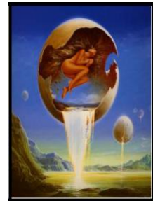
Рис. 8. С. Войтек «Еволюція»