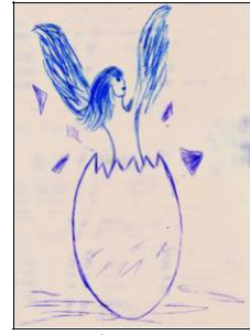
Рис. 4. Я йду на зустріч біді