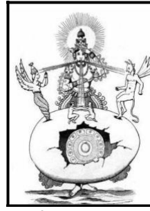
Рис. 3. Праждапати створює світ