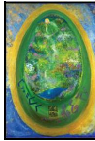
Рис. 7. В. Преображенська «Русь споконвічна»