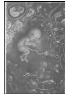
Рис. 12. Страх, приреченість на муки і жах

Подібно до символу яйця є символ мушлі – еротичний, жіночий символ, пов'язаний із зачаттям, оновленням, хрещенням, процвітанням; символ самоаналізу і втечі від реальності. Зазначені нижче малюнки (див. рис. 13-15), презентують тему народження, життя, жіночий початок, символ чистоти, цнотливості, досконалості, скромності і схильності до самотності, капсулювання у внутрішньому світі, закритість, неусвідомлене прагнення повернення в утробу матері.