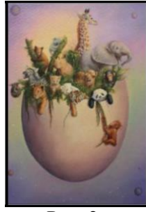
Рис. 2. Космічне яйце