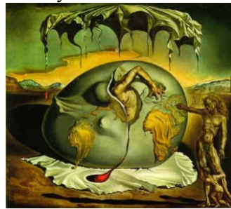
Рис. 11. С. Далі «Після віку тривоги»