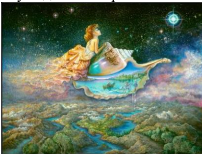
Рис. 13. Ж. Уол «Дотягнутися до зірки»

Подібно до символу яйця є символ мушлі – еротичний, жіночий символ, пов'язаний із зачаттям, оновленням, хрещенням, процвітанням; символ самоаналізу і втечі від реальності. Зазначені нижче малюнки (див. рис. 13-15), презентують тему народження, життя, жіночий початок, символ чистоти, цнотливості, досконалості, скромності і схильності до самотності, капсулювання у внутрішньому світі, закритість, неусвідомлене прагнення повернення в утробу матері.