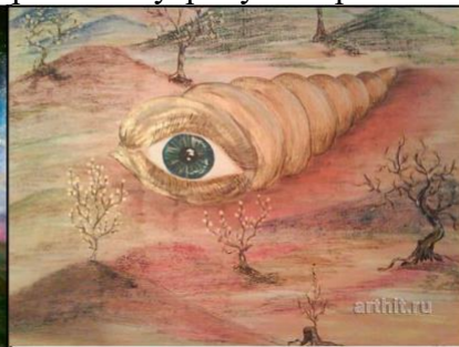
Рис. 14. Д. Апрельская «Мушля»