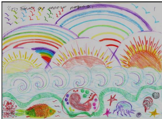
Рис. 19. Що було до мого народження