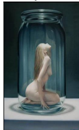
Рис. 21. Н. Мур «Прекрасна баночка»