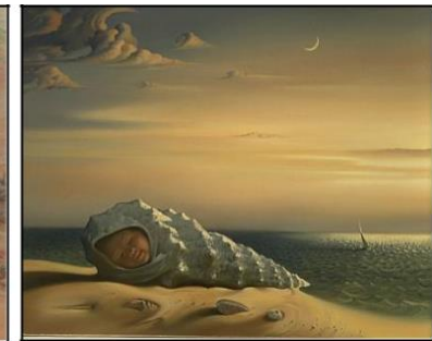
Рис. 15. В. Куш. «Зародження життя»