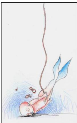
Рис. 17. Моє народження