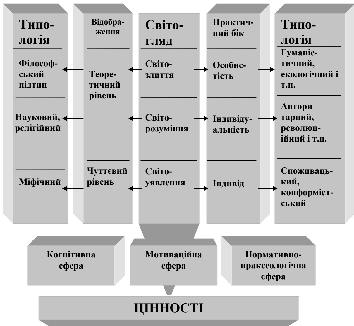
Мал. 2. Структура світогляду

Для вираження цих загальних властивостей, зв'язків і відносин, філософії потрібні особливі поняття, які називаються категоріями. Категорія – це філософське поняття, яке фіксує істотну властивість, зв'язок, відношення, притаманне явищам всіх сфер дійсності (буття, рух, час, простір, кількість, якість, протилежність і т.д.).