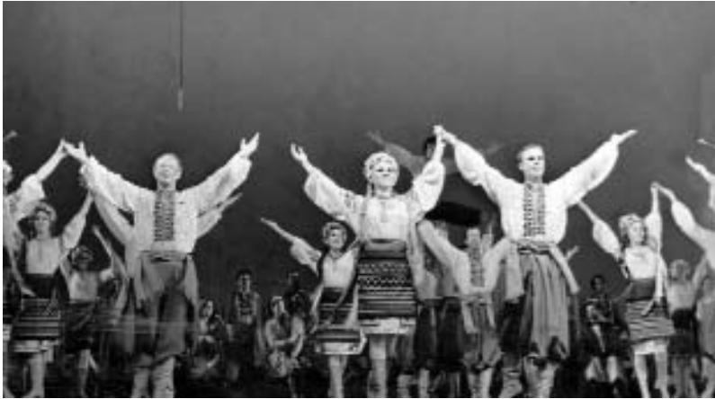
Виступ артистів Черкаського народного хору

Черкасах виросла ціла плеяда талановитих виконавців, які згодом, разом зі своїм наставником, поповнили провідний хор республіки імені Верьовки.