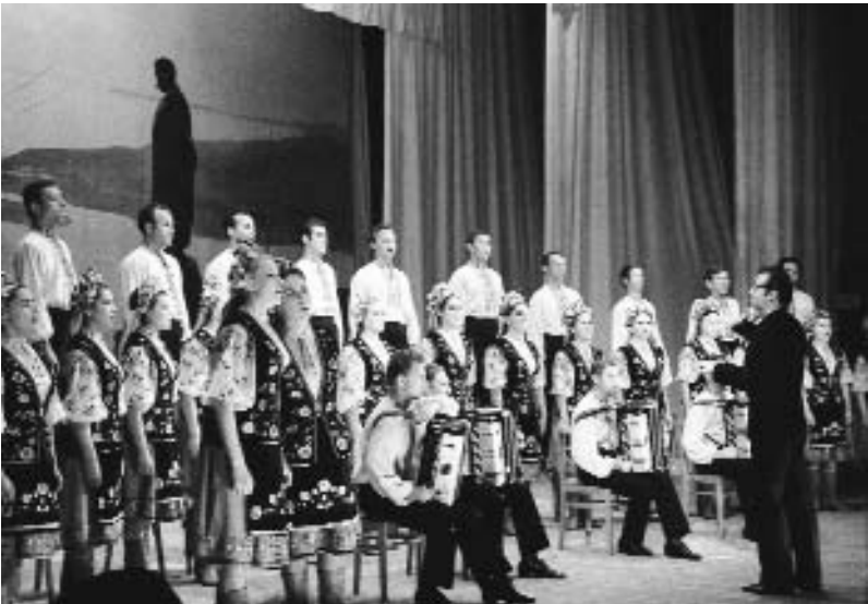
Черкаський народний хор

Стрімко увірвавшись у світ професійного мистецтва, Черкаський народний хор розпочав свій нелегкий, але зігрітий людською вдячністю і любов'ю творчий шлях. Концерти хору в містах і районах області, під час гастролей в Україні, республіках СРСР та за кордоном супроводжувалися заслуженим і незмінним успіхом. Впродовж 1963–1966 років біля керма хору стояв А. Авдієвський – майбутній керівник ушлякеного хору імені Верьовки, нині Герой України. Під його керівництвом в