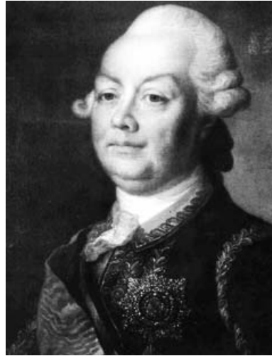
Портрет Петра Румянцева- Задунайського

росії граф Рум'янцев дав ряд доручень (ордерів) своїм підлеглим щодо облаштування на новому місці іноземних переселенців та їх грошового забезпечення. Одне з них було адресоване Канцелярії малоросійського скарбу, яка через комісарів Переяславського і Золотоніського повітів мала акумулювати необхідну суму коштів. Інше – управителю казенних кантакузінських маєтностей Микиті Ашаніну, якого призначили розпорядником цих коштів і наглядачем над іноземними переселенцями.