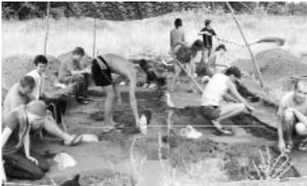
Учні – члени МАН, на археологічних розкопках Молюхового бугра. 2011 р.

Самостійним напрямом краєзнавчої роботи з учнями є організація і проведення літніх археологічних експедицій, під час яких учні-члени МАН беруть участь у розкопках відомого поселення доби нео-енеоліту Молюхів Бугор поблизу села Новоселиця Чигиринського району, а пізніше, протягом навчального року, вивчають знайдені археологічні колекції та