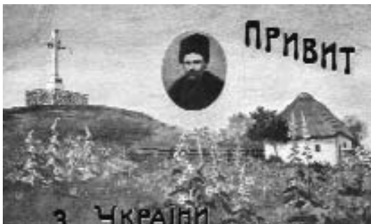
Привіт з України (з портретом пензля А. Монастирського. Вид. невідоме. 1910-ті роки

рував музею шість унікальних старовинних поштових карток з краєвидами Тарасової гори, серед яких “Привіт з України (З портретом пензля А. Монастирського)”. Це барвиста ошатна комбінована листівка-