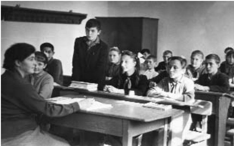
Урок літератури в Кам'янській середній школі №1

На виконання завдань реформи освіти в школах області організовувалося виробниче навчання і виробнича практика з метою поєднання навчання з продуктивною працею дітей (вся молодь віком 15–16 років повинна була включатися у посильну суспільно-корисну працю). Школи почали називатися середніми загальноосвітніми трудовими політехнічними з виробничим навчанням. Навчання в реформованих школах тривало 11 років, з них в останні три роки основна увага приділялася професійній підготовці в одній із галузей народного