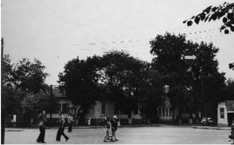
У центрі Черкас. 1950-ті роки

У селах ще можна було побачити землянки, невеликі приземкуваті хатки”.