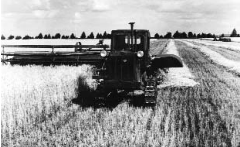
Збір урожаю в колгоспі імені Сталіна Смілянського району. 1958 р.