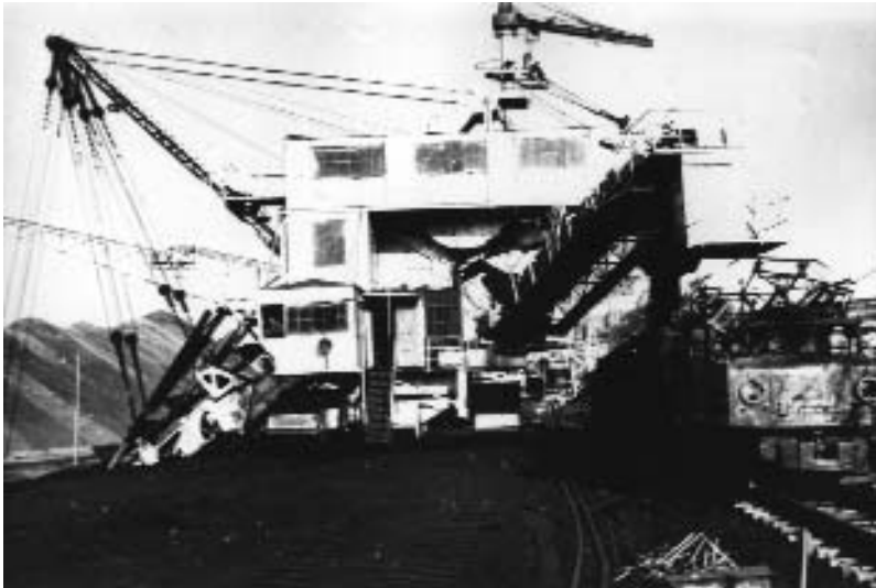
Транспортно-відвальний міст. 1954 р.

Досить швидко формувався територіально-виробничий комплекс навколо шахтарського міста Ватутіне, що постало в повоєнні роки в степу за 10 км від Звенигородки. Зростав видобуток бурого вугілля в розроблюваному поблизу міста Юрківському буровугільному басейні. Якщо в 1955 році видобуток вугілля тут складав 1,8 млн. тонн, то в 1958 році – 2,4 млн. тонн. Однотимчасно з шахтним способом наприкінці 1953 року розпочався відкритий видобуток вугілля небаченим в наших краях транспортно-відвальним мостом, який дістався ватутінським гірникам за репараціями з переможеної у війні Німеччини. Цей самохідний агрегат спроможний був розробляти