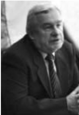
В. Ф. Солдатенко

1 березня 2012 року в Черкаському національному університеті імені Богдана Хмельницького відбулася зустріч члена правління Національної спілки краєзнавців України, директора Українського інституту національної пам'яті, доктора історичних наук, професора, члена-кореспондента НАН України Валерія Федоровича Солдатенка з краєзнавчим активом області. Серед присутніх – науковці, працівники Державного архіву Черкаської області, обласного краєзнавчого музею, освітяни, журналісти, студенти.