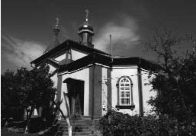
Абаклійська церква у Молдові