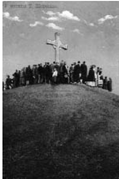
Біля могили Т. Шевченка. Вид. А. Ріхтер. Київ. 1911 р. №417

Однією з перших листівок, що надійшли до фондової колекції Шевченківського національного заповідника, є листівка “Канів. Загальний вигляд з боку Дніпра на могилу Тараса Шевченка”, на