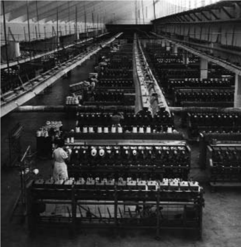
Цех заводу хімічного волокна. 1960-і рр.

року згідно постанови республіканського уряду відбулося об'єднання заводу азотних добрив із заводом іонообмінних смол, що будувався, і таким чином було визначено повну остаточну назву підприємства – Черкаський хімічний комбінат (нині – ВАТ “Азот”). Вже у грудні наступного року на комбінаті введено в дію відділення з виробництва аміачної води потужністю 432 тис. тонн у рік, а 14 березня 1965 року – здано в експлуатацію першу чергу виробництва аміаку потужністю 108 тисяч тонн щороку й отримано перший аміак.