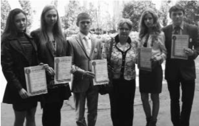
Команда Черкаської області (відділення “Історія”) – переможень Всеукраїнського конкурсу МАН 2013 року.

Члени журі конкурсу, до складу якого увійшли науково-педагогічні працівники Черкаського національного університету імені Богдана Хмельницького, Уманського державного педагогічного університету імені Павла Тичини, Черкаського державного технологічного університету, досвідчені працівники загальноосвітніх та позашкільних навчальних закладів області, відзначили широкий спектр наукової тематики, актуальність переважної більшості науково-дослідницьких робіт, належний