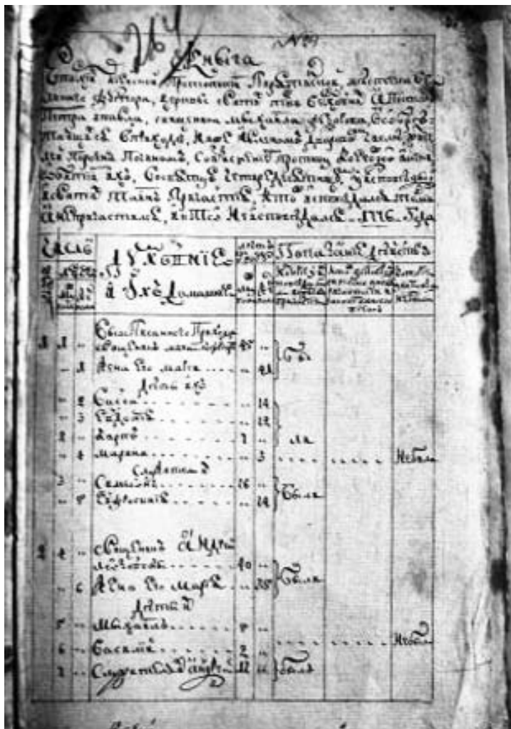
Фрагмент сповідальної книги сільської церкви Петра і Павла, до якої були притисані румунські колоністи