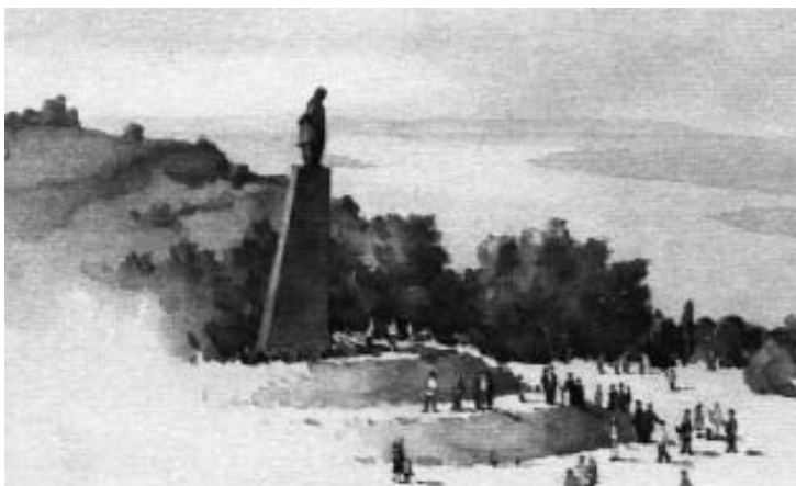
Ю. Вербіцький. Пам’ятник Т. Шевченку в Каневі. Харків

монтаж з портретним зображенням Т. Шевченка та могилою поета в Каневі. Такі поштові картки – це теплі привітання, отримавши які здавалося що тримаєш маленьку частку України в руках. Мальовничі українські краєвиди: широкі лани, білі хати з солом’яними стріхами, мальви та соняшники, дівчата і хлопці в українських костюмах, ставки біля яких ростуть старі похилі верби, вітряки – ці символи об’єднували українців між собою. Вони були надзвичайно різноманітними, але на кожній обов’язково постає портрет Тараса Шевченка, як безперечний символ української державності.