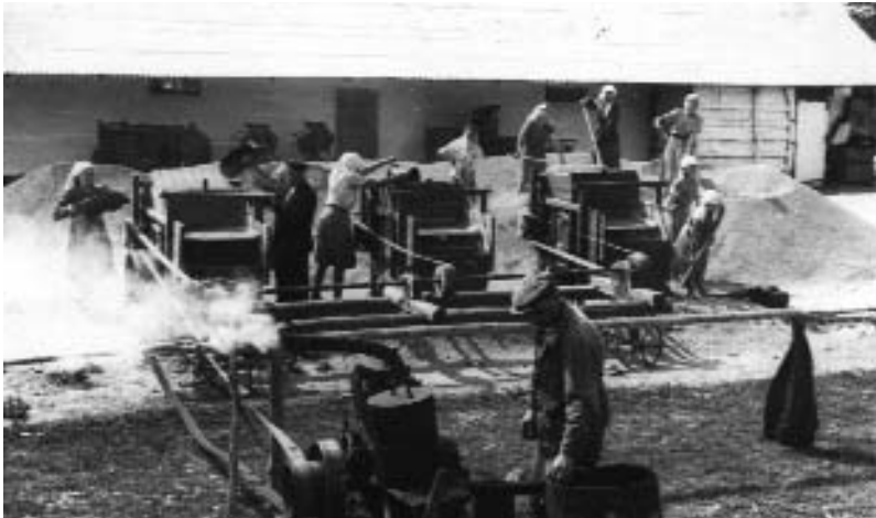
На току колгоспу імені III Інтернаціоналу Золотоніського району. 1957 р.

Поліпшувався якісний склад керівників сільськогосподарського виробництва. В 1955 році на посади голів колгоспів Черкащини в рамках руху тридцяти тисячників було направлено