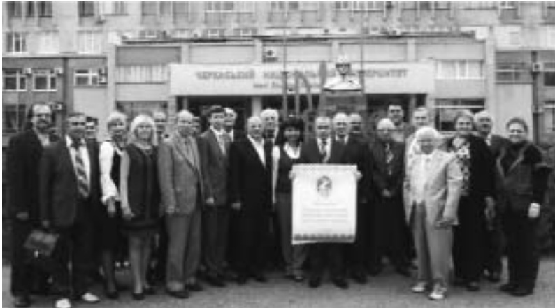
Учасники засідання президії НСКУ біля головного корпусу Черкаського національного університету імені Богдана Хмельницького

На засіданні Президії гостро стояло питання про поліпшення організаційної роботи регіональних осередків Спілки, адже досі значна частина з них не завершила в установленому порядку своєї реєстрації, не веде належної роботи з обліку членів Спілки. Про це йшлося у виступах