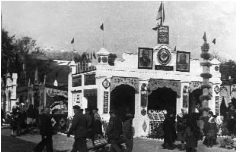
Районна сільськогосподарська виставка у Кам'яниці. Павільйон колгоспу "Жовтень". 1954 р.

Вже в червні 1954 року за результатами республіканського соціалістичного змагання було відзначено значне поліпшення роботи тваринницької галузі області, а Шполянський район