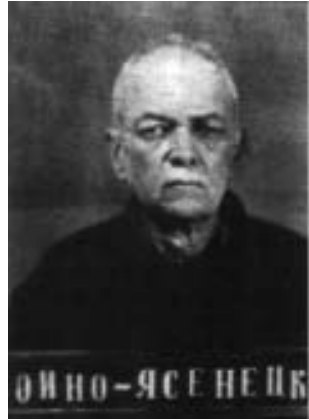
В. Ф. Войно-Ясенецький під слідством

“Ходіння по муках” святителя продовжилися в 1930-х роках: ще двічі сходяв він на Голгофу нелюдських страждань. Уже в 1930 р. настав новий арешт і через рік після виснажливих допитів єпископа етапом направили в Північний край. Виснажливі поневіряння професора-єпископа тимчасово скінчилися у 1934 р., наступні два роки видалися для нього відносно тихими і мирними: у Ташкенті він очолив головну операційну Інституту невідкладної допомоги, продовжив свої наукові студії. Та