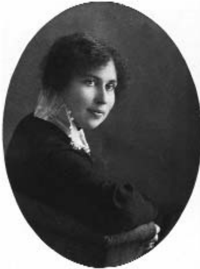
Надія Суровцова, 1914 р.

Період другої половини ХХ століття став одним з найнаситеніших в історії України. Події світового значення з небаченою швидкістю змінювали одна одну. Свідком і безпосереднім учасником тогочасних подій стала Надія Віталіївна Суровцова – особистість легендарна і багатогранна.