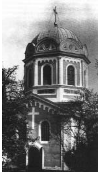
Свято-Троїцький кафедральний собор у Сімферополі