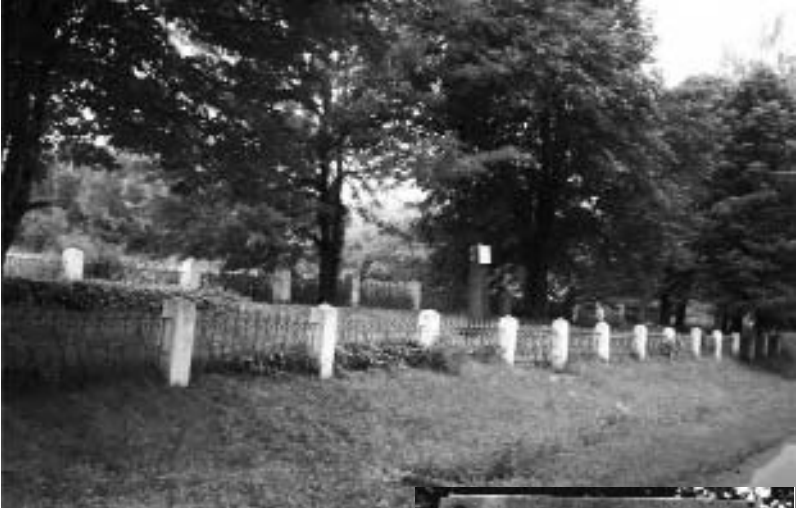
Братська могила на місці розстрілу громадян єврейської національності у 1942 р. Фото 2012 р.