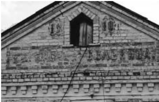
Городище. У 1910 р. це була єврейська лікарня (нині – приміщення райвійськкомату). Фото 2009 р.

щення районного військкомату і на будівлі ще видно викладений цеглою напис: “Еврейская больница”.