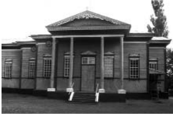
Церква в селі Великий Хутір, заснована в 1775–1776 рр.

Ті ж іноземці, що відмовилися від переселення у південні степи й залишилися на великохутірських землях, згодом втратили свої привілеї й були прирівняні до звичайних кріпаків, які відробляли ка-