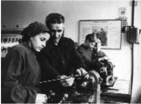
Урок виробничого навчання

господарства. В старших класах шкіл почали готувати водіїв, механізаторів, будівельників та спеціалістів інших професій, які потім багатьом випускникам згодилися у житті.