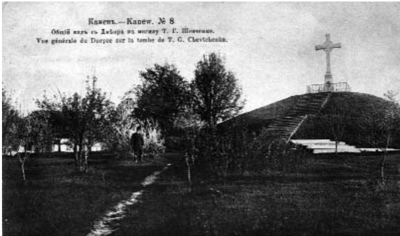
Канів. Загальний вигляд з Дніпра на могилу Т. Г. Шевченка. Вид. Т. Бутвина. 1915 р. №8

могили у Каневі” та багато інших. Працівниками заповідника сходжено безліч стежок до збирачів і товариств колекціонерів, надіслано і отримано відповіді на масу листів, опрацьовано чимало доповідей і лекцій про філокартію з метою отримання експонатів. За кожною новою річчю, що надходить до колекції, стоїть кропітка праця музейників.