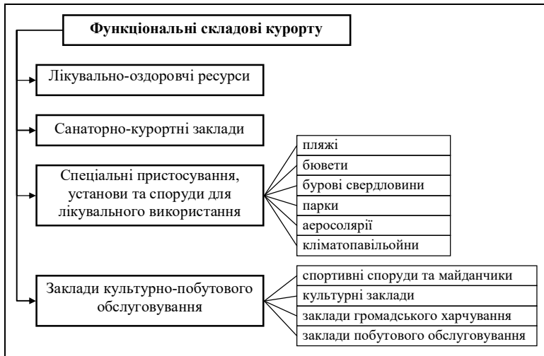
Рис. 1. Функціональна структура курорту (В.І. Новикова, 2011) [5]

На базі трьох основних природних лікувальних чинників розрізняють три типи курортів: бальнеологічні, грязьові та кліматичні. На бальнеологічних курортах головним лікувальним чинником є мінеральні води, що можуть використовуватись для внутрішнього прийому (пиття) та зовнішнього застосування у вигляді ванн, душів, зрошувань, купань. Грязьові курорти знаходяться поблизу родовищ лікувальних грязей (пелоідів). Серед кліматичних курортів виділяють гірські, приморські, лісові та степові на рівнинах, кожному з яких притаманні унікальні комбінації клімато-погодних характеристик, що забезпечують лікувальний ефект. Поряд з основними виділяються змішані курорти, на яких одночасно використовується кілька природних лікувальних ресурсів (рис. 2).