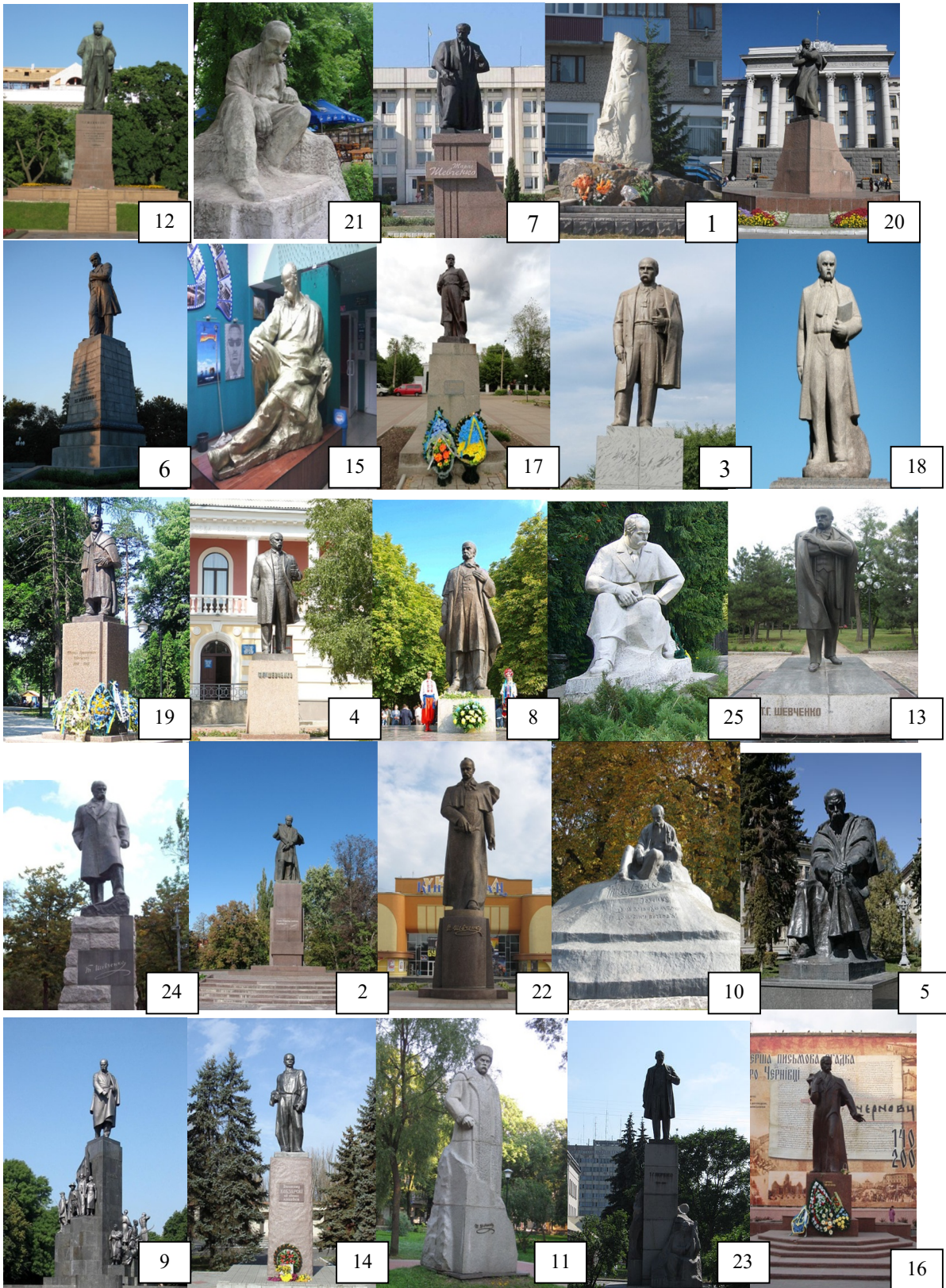
Рис. 1. Скульптурні пам'ятники Тарасу Шевченку в Україні в таблиці Шульте