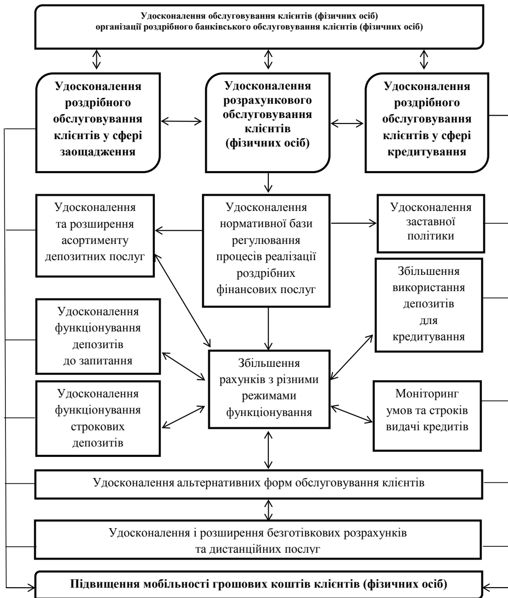
Рис. 2. Комплекс заходів щодо вдосконалення організації роздрібно-банківського бізнесу Джерело. Розроблено авторами.

Разом з тим комплексний підхід банку до організації залучення коштів, кредитування і розрахунків клієнтів (фізичних осіб) дозволить збільшити кількість нових видів роздрібних банківських послуг. Оскільки банки зацікавлені у збільшенні залучених депозитів, що тимчасово є в їхньому користуванні, банкам необхідно постійно удосконалювати форми та методи збільшення вкладників. Одним з ефективних напрямів є запровадження вкладних рахунків із різними функціональними режимами, які поліпшать можливості клієнтів використати свої кошти.