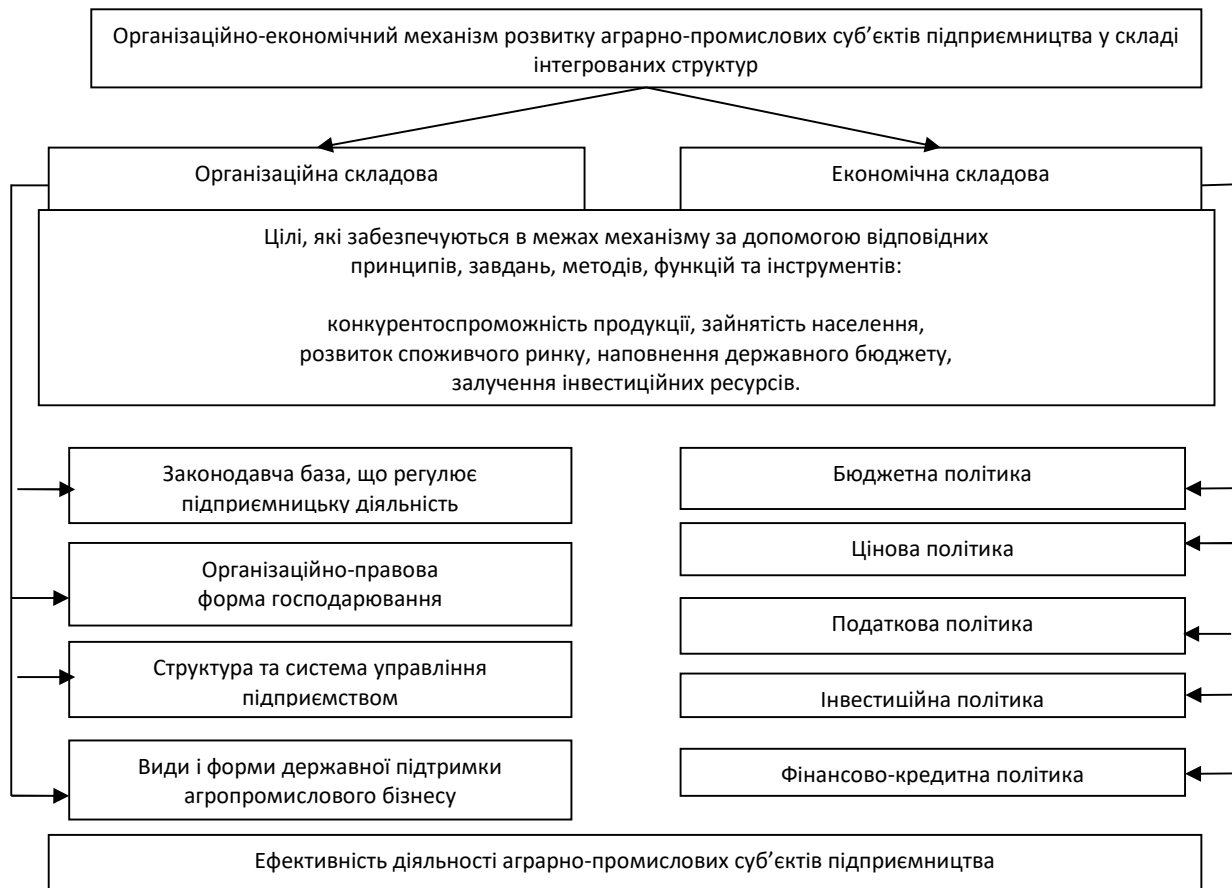
Рисунок 1 – Механізм розвитку аграрно-промислових суб'єктів підприємництва у складі інтегрованих структур

Система організаційно-економічного механізму розвитку аграрно-промислових суб'єктів підприємництва у складі інтегрованих структур передбачає взаємозалежні елементи організаційних та економічних засобів управління, що впливають на забезпечення їх виробничо-господарської діяльності з найефективнішим формуванням та використанням ресурсів (рис. 1).