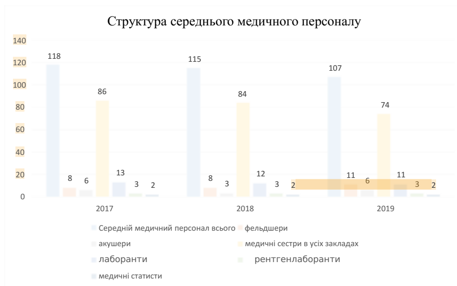
Рис. 2.3. Структура середнього медичного персоналу у динаміці за 2017-2019 рр.