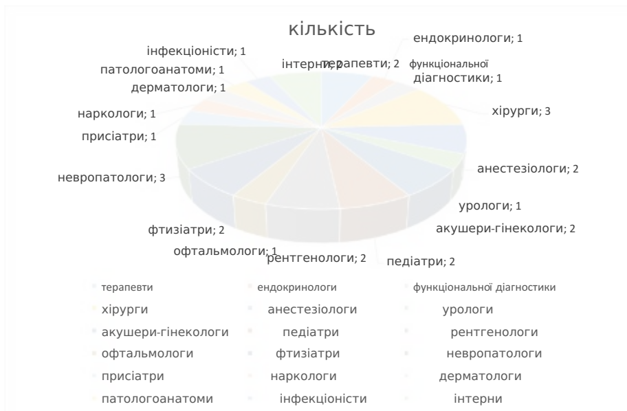
Рис. Структура лікарів за професійним спрямуванням у 2019 році.

лікарні працює по два терапевти, анестезіологи, акушер-гінекологи, педіатри, рентгенологи, фтизіатри. Всіх інших вузькопрофільних спеціалістів по одній особі.