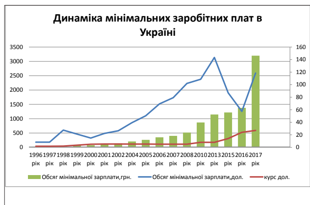
Рис. 1. Динаміка мінімальних заробітних плат в Україні з 1996 по 2017 роки

Ми відстежили динаміку мінімальних заробітних плат в Україні з 1996 по 2017 роки, використовуючи інформацію з Державних бюджетів відповідних років, та зіставили її з курсом гривні відповідного періоду (рис. 1).