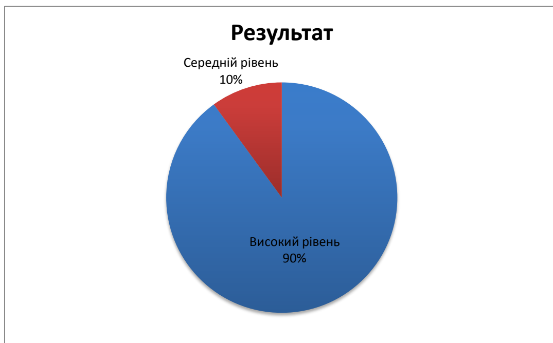
Рис.3.1. Результати контрольного тестування дітей щодо визначення рівня розвитку дрібної моторики

Результати тестування дітей представлено на рисунку 3.1.