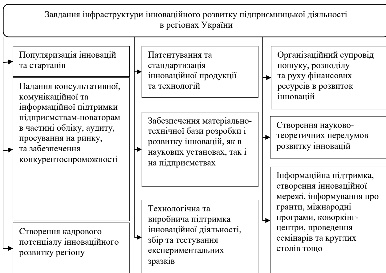
Рис. 1. Завдання інфраструктури інноваційного розвитку підприємницької діяльності в регіонах України

Процес забезпечення інвестиційно-інноваційного розвитку є динамічним, що зумовлено мінливістю інноваційних розробок, динамічністю ринкових відносин та гнучкістю інвестиційних процесів. На кожному етапі розробки та реалізації напрямків забезпечення інвестиційно-інноваційного розвитку підприємництва в регіонах України мають бути враховані елементи їх пластичності та можливості оперативної та адекватної реакції на зміни в ринковій, науковій та технічній кон'юнктурі, проте знаходитися виключно в межах основних державних політик.