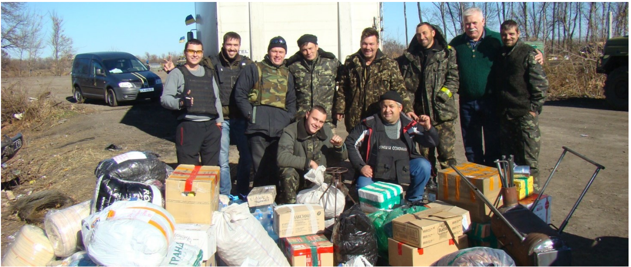
Серед волонтерів, Донецька обл., м. Дебальцеве, 2015 р.