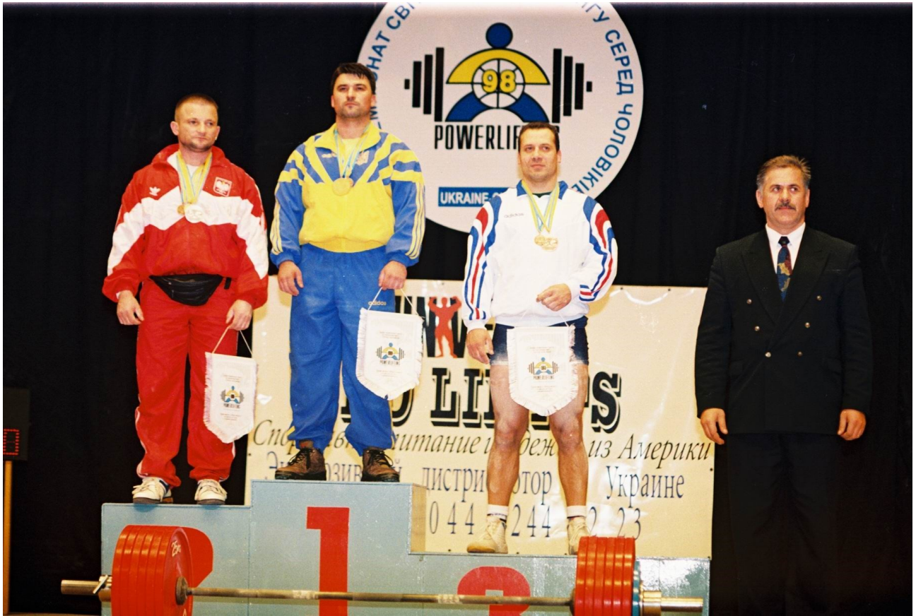
На церемонії нагородження. Чемпіонат світу серед чоловіків (Україна, м. Черкаси, 1998 р.).