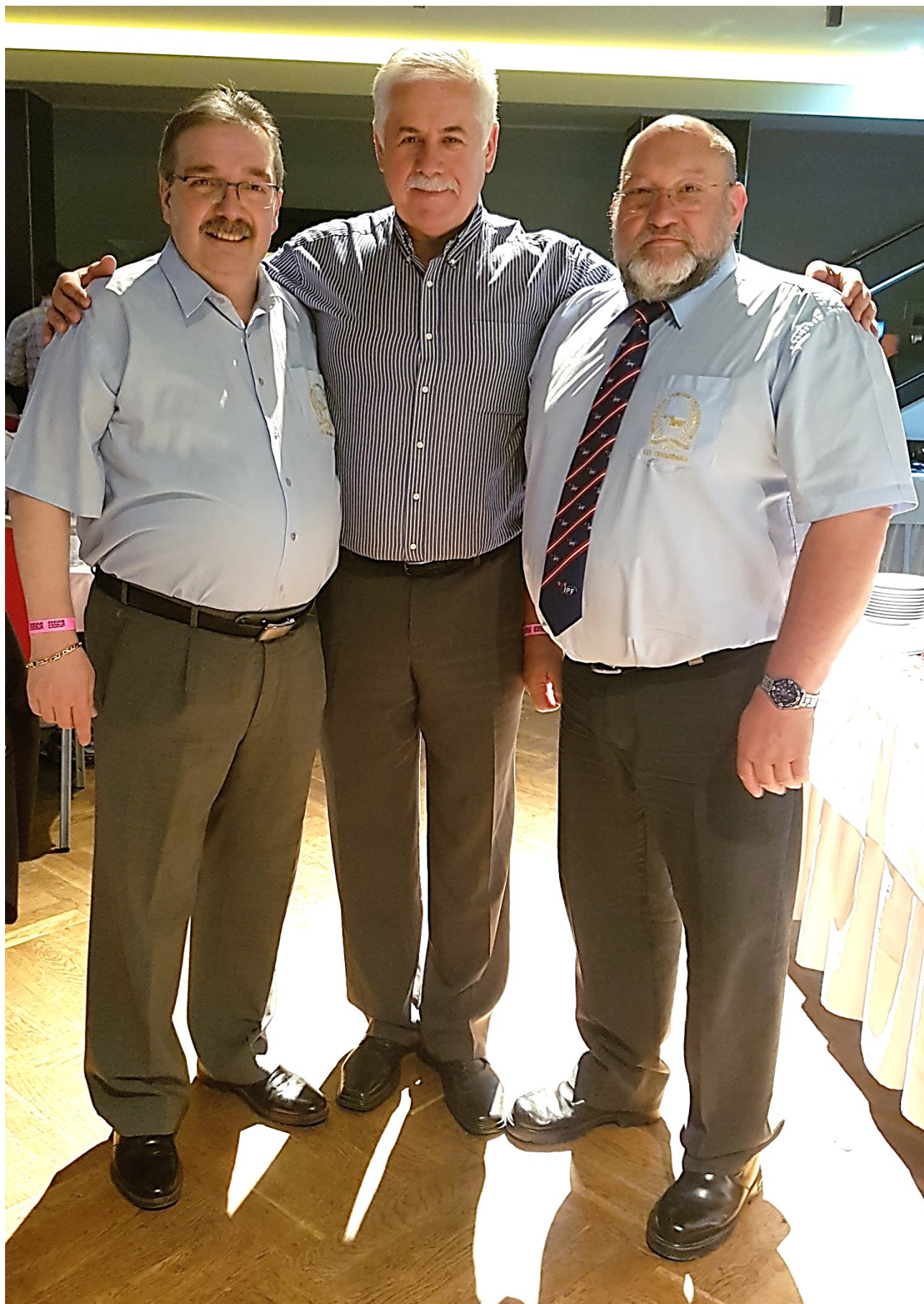
Чемпіонат світу з пауерліфтингу у м. Плідень, Чехія, 2017 р. (ліворуч – президент IPF Гастон Парадж, Люксембург, праворуч – голова технічного комітету Йохан Сміт, ПАР).