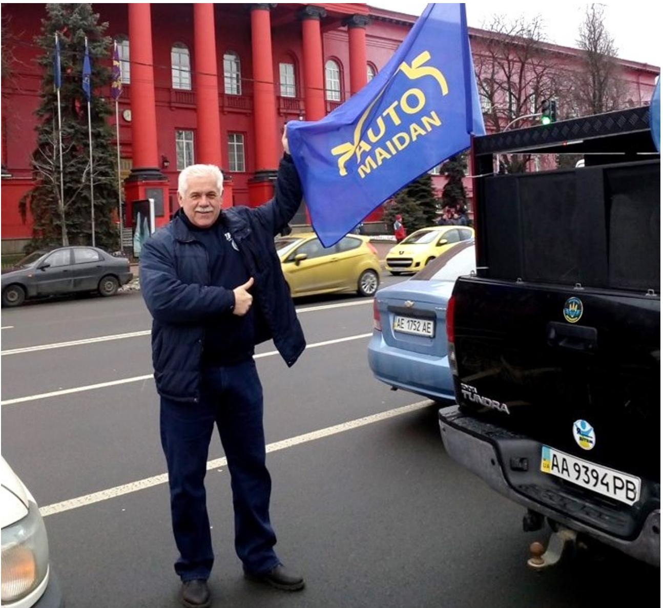
Учасник акції ВГО "Автомайдан", м. Київ, 2018 р.