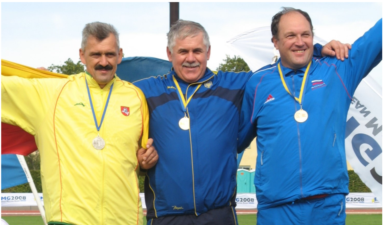
Європейські ігри серед ветеранів (Швеція, м. Мальме, 2008 р.).