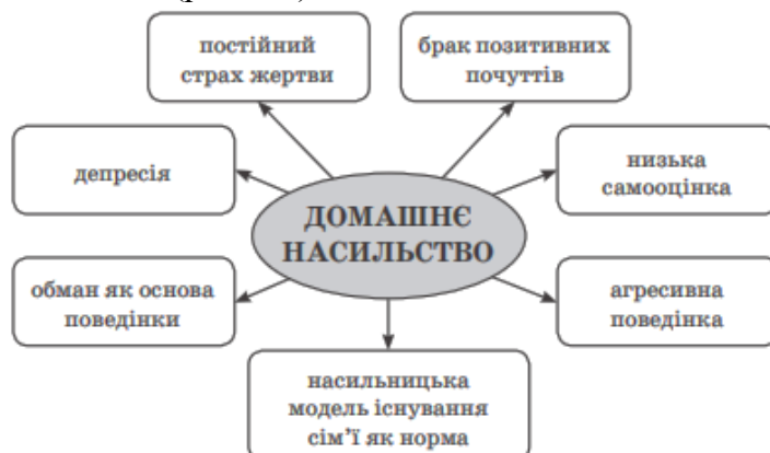
Рис. 1.1. Наслідки домашнього насильства

чотири форми домашнього насильства серед яких: фізичне, сексуальне, психологічне та економічне [2]. Так, будь-який вид насильства щодо дітей веде до найрізноманітніших наслідків, але поєднує їх одне – збитки здоров'ю дитини, перешкоджання її оптимальному розвитку чи небезпеку для її життя (рис.1.1.)